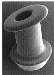
Aspect au MEB SEM appearance